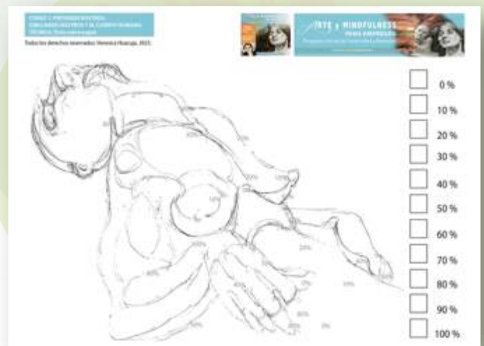
Imagen 1 de 11. Este es el ejercicio de arte que deberás descargar de la liga mencionada.

PARTE 1. TU MEDITACIÓN MINDFULNESS. Logra tu paz interior a través de la meditación.