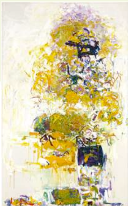
Imagen 4 de 11. "Girasol VI" de Joan Mitchell. Nota el gesto en esta obra semifigurativa.