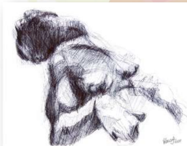
Imagen 5 de 11. Ejercicio finalizado. Percibe el gesto en este dibujo figurativo.

Es importante tomar en cuenta que tú tienes tu propia búsqueda de expresión, por lo que los resultados serán diferentes. Esa es una de las partes interesantes de esta práctica.