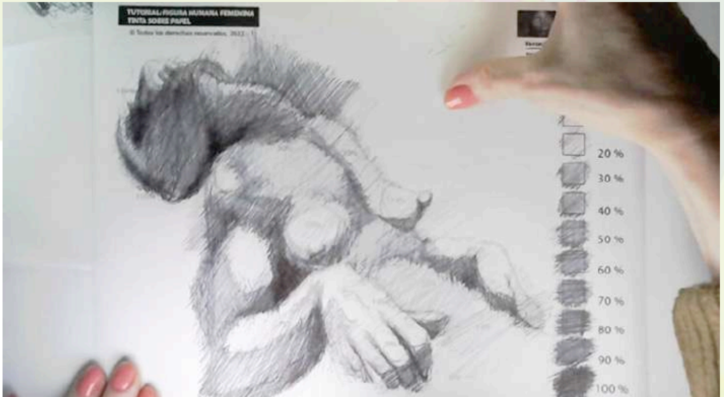
Imagen 11 de 11. Fase final del ejercicio.