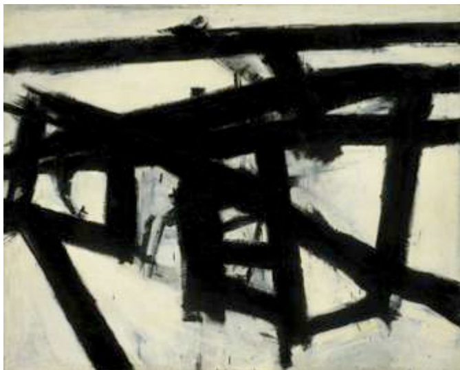
Imagen 2 de 11. "Mahoning" por Franz Kline. Percibe el gesto en esta obra abstracta.

Las siguientes imágenes son obras de distintos pintores. En ellas el gesto se manifiesta con gran o sutil fuerza. Permite que tu mirada recorra cada pintura de manera “abierta”, a la manera como has realizado tu meditación. Siente las líneas, los espacios, colores. Imagina, reflexiona, establece conexiones entre la obra y tus experiencias personales, entre otras actividades internas.