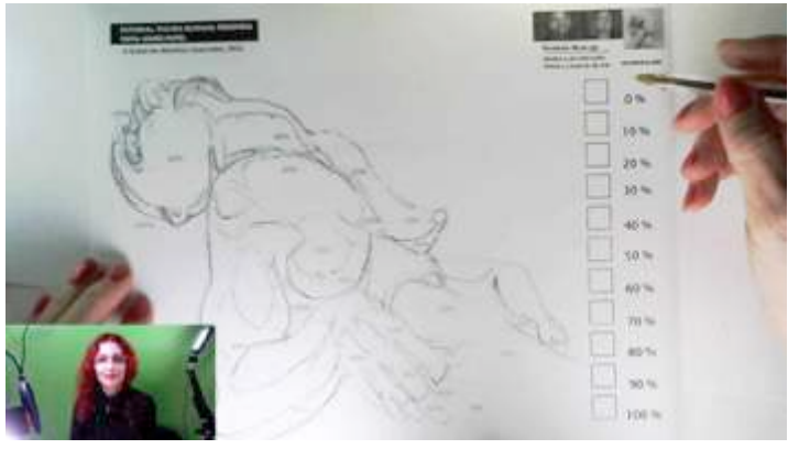
Imagen 6 de 11. Inicia la primera parte de tu ejercicio: dibuja las casillas de acuerdo al porcentaje marcado en cada una.