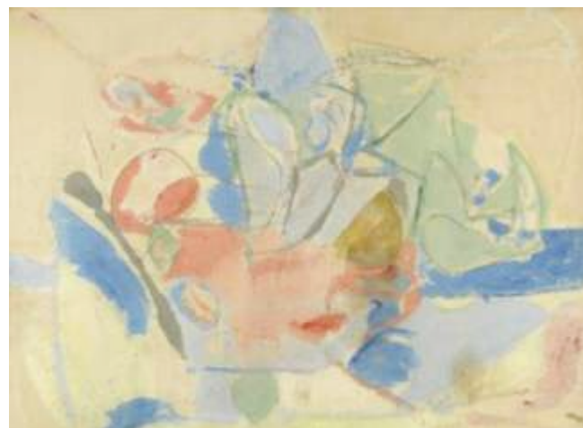
Imagen 3 de 11. "Montañas y Mar" de Helen Frankenthaler. Advierte el gesto en esta obra semiabstracta.

Colección: Whitney Museum of American Art, Nueva York, NY, E.U.A.