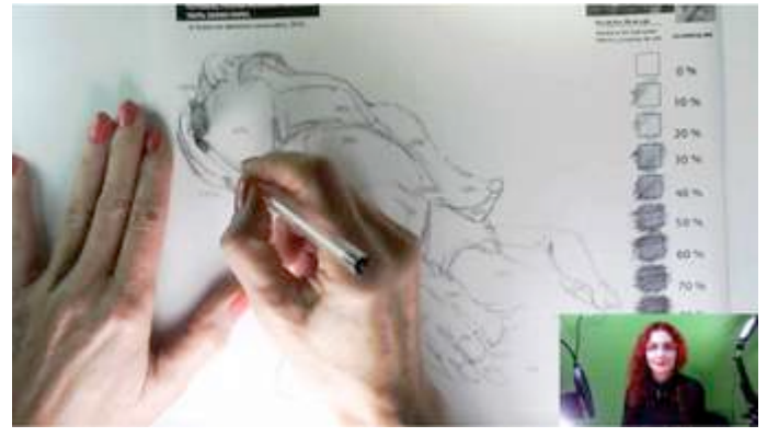
Imagen 10 de 11. Al dibujar, entrelaza las líneas, crúzalas.

Ahora, realiza la segunda actividad del ejercicio: relaciona el porcentaje de tinta que has dibujado en las casillas con los porcentajes marcados en la figura (posicionada en la izquierda de tu ejercicio). Comienza dibujando el área del 100% de tinta en la figura. Es decir, inicia el dibujo del rostro, propiamente, el área de los ojos. Continúa dibujando las otras áreas haciendo esta misma relación.